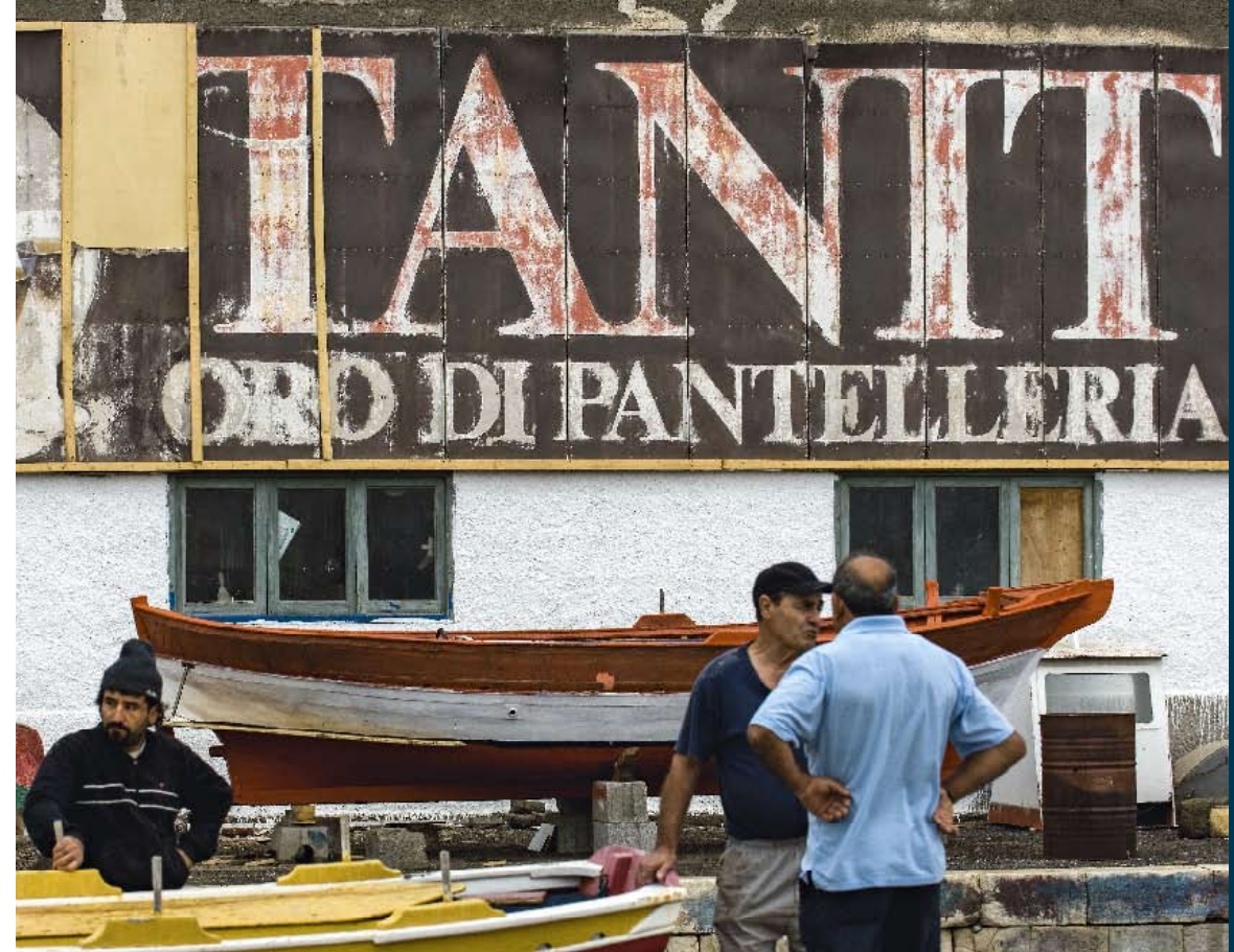
A sinistra: il porto di Pantelleria con una vecchia insegna che pubblicizza il moscato liquoroso Tanit. Sotto: lo Specchio di Venere, piccolo lago di Pantelleria alimentato da sorgenti termali. Nella pagina precedente, in alto: i vigneti delle cantine Donnafugata in contrada Khamma, sempre sull’isola “nera”; in basso: un momento della vendemmia.

Pantelleria, la “perla nera del Mediterraneo” al largo delle coste trapanesi e tunisine, vanta un paesaggio agrario punteggiato di piccole vigne ad alberello, con 12mila km di muretti a secco che delimitano i campi, 2mila giardini arabi e 8mila dammusi, le tipiche case rivestite di roccia lavica dal tetto bianco a cupola. Elementi che accompagnano da un capo all’altro dell’isola: dal porticiolo di Gadir, con le sue vasche d’acqua calda dove immergersi prima di un tuffo in mare, fino al laghetto vulcanico Specchio di Venere: una tavolozza azzurra che vira gradualmente verso il blu →