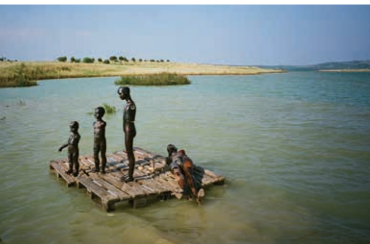
Work in progress della sistemazione dell'opera Avvistamento nel lago di Lentini in occasione della mostra "Ratio Naturalis".

F.A. Quale episodio e quali stimoli artistici hanno determinato il tuo interesse per il fenomeno della emigrazione?