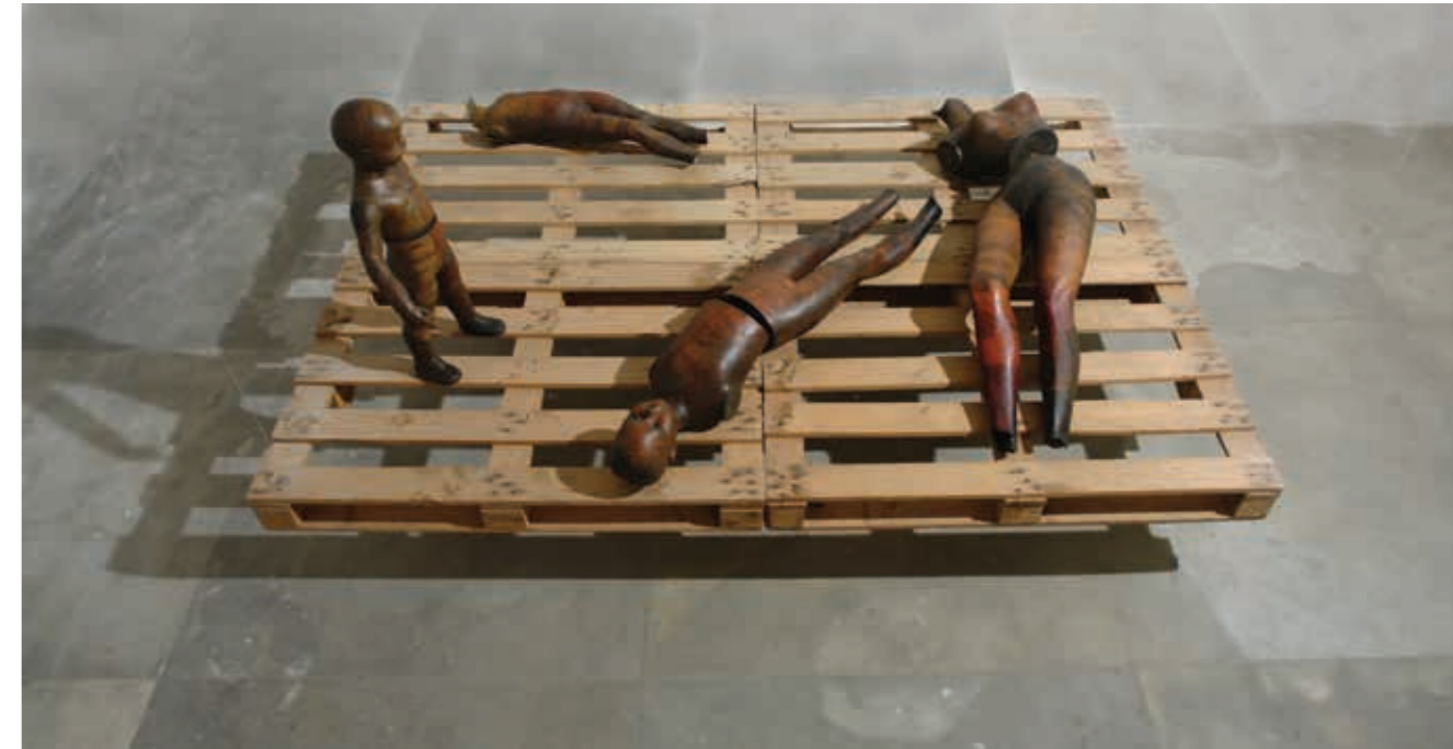
Avvistamento - 2005 - opera realizzata per la mostra "Ratio Naturalis" - lago di Lentini

La scelta dei manichini fu dettata dal fatto che il manichino è un oggetto che rappresenta una personalità anonima, sta in vetrina e non vi si attribuisce alcun valore umano, è l'emblema dell'indifferenza, come d'altronde sono considerati nella realtà i migranti, corpi privati della propria identità. Li ruppero in alcune parti e li dipinsi con rapide pennellate in mescolanze di bruni e ocre, neri e rossi, e da quelle partiture, in una fusione cromatica; così